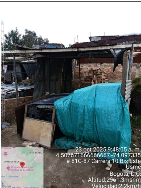
ID 1141: 4,507639, -74,097328

Secretaría Distrital de Ambiente Av. Caracas N° 54-38 PBX: 3778899 / Fax: 3778930 www.ambientebogota.gov.co Bogotá, D.C. Colombia