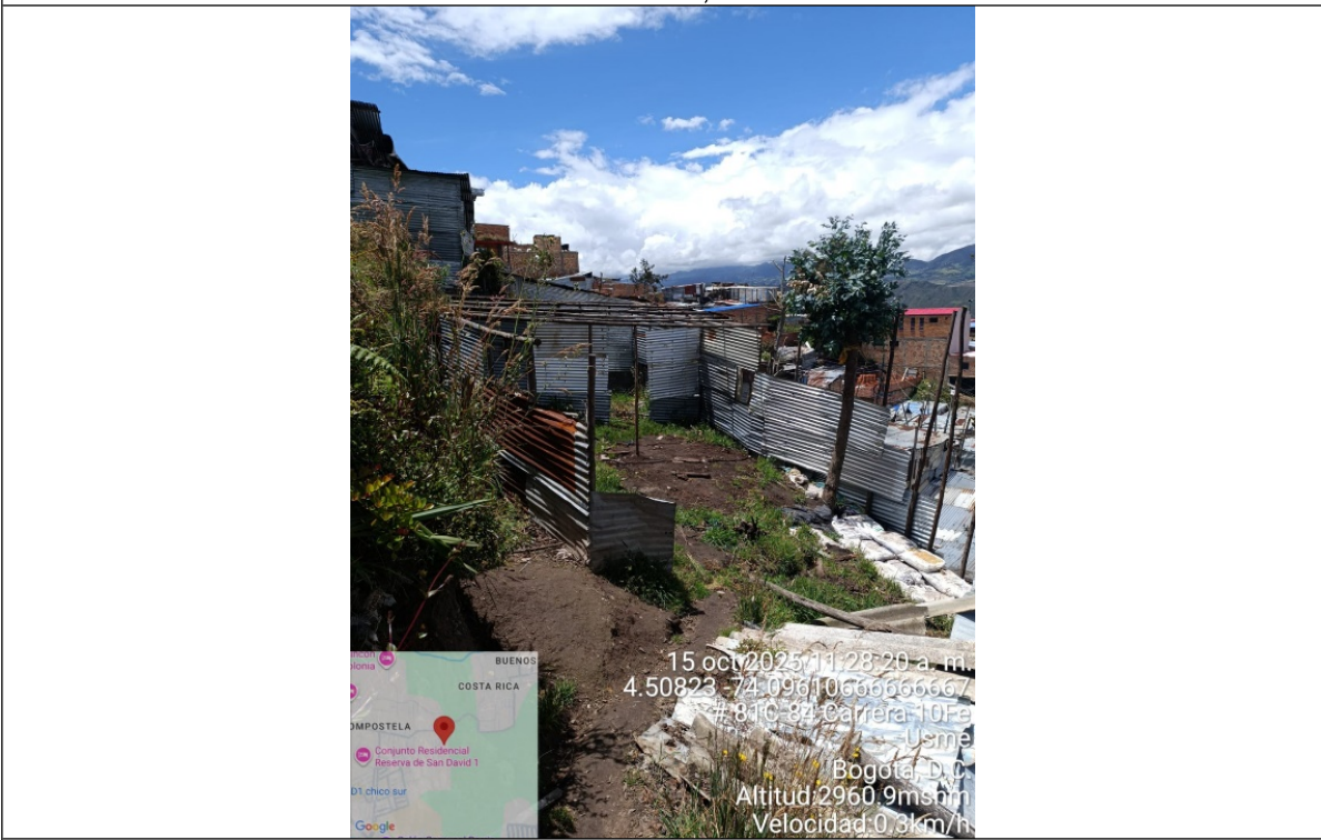
ID 1354: 4.50823, -74.096106

Secretaría Distrital de Ambiente Av. Caracas N° 54-38 PBX: 3778899 / Fax: 3778930 www.ambientebogota.gov.co Bogotá, D.C. Colombia