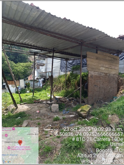
ID 1375: 4.508363, -74.097526